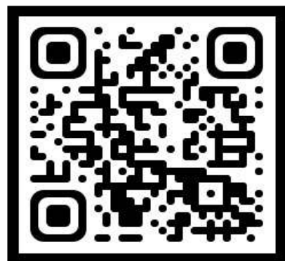
'25 교육활동 안내

https://youtu.be/qzcleqk3iz0?si=WCF1_olfXrwawwUK